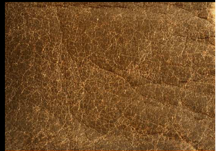
PIEL NAPA DE CONSUMO CÁRNICO.