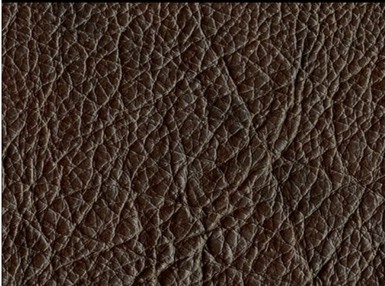
PIEL DE VACUNO DE CONSUMO CÁRNICO HUMANO